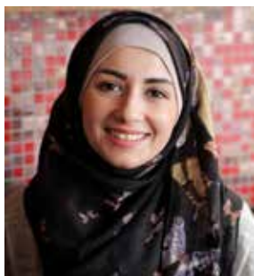
Hala: Antireligiöst motiv, islamofobiskt.