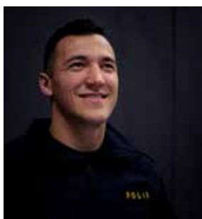
Valon: Antireligiöst motiv, islamofobiskt.