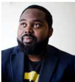
Jallow: Hudfärg, etnicitet, rasism, afrofobi.