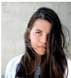
Elsa: Sexuell läggning.

Samtliga motivkategorier finns representerade i berättelserna: