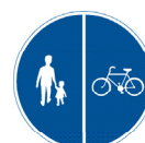
Gång- och cykelbana som är delad med en linje.