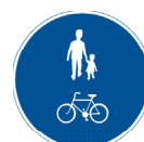
Gemensam gång- och cykelbana