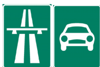
Motorväg och motortrafikled