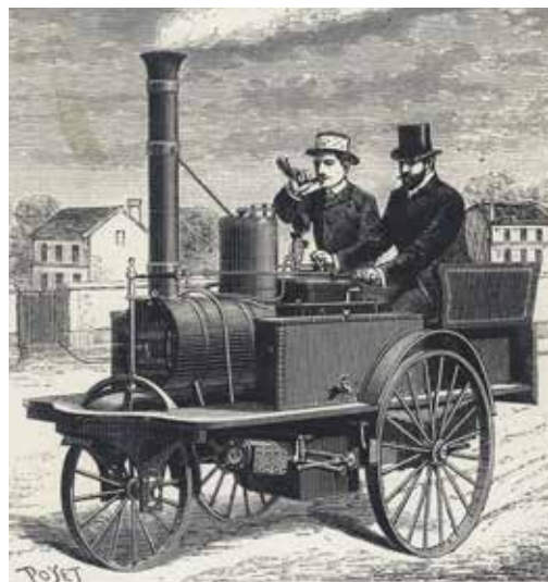
Ångbil Frankrike 1886.

En av världens första fordon som liknade en bil och som kunde transportera människor drevs av ånga och det var i slutet av 1700-talet. Det var en vagn som rymde fyra personer och som gick i 4 km/h. Det är ungefär samma hastighet som när du går snabbt. Den första bil som tillverkades i Sverige var också en ångbil och det var år 1892. Men ångbilarna övergavs efterhand, de gick för långsamt och behövde fyllas på med vatten väldigt ofta.