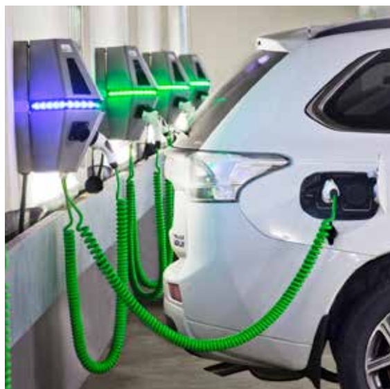
Elbil vid laddstation ca år 2017.