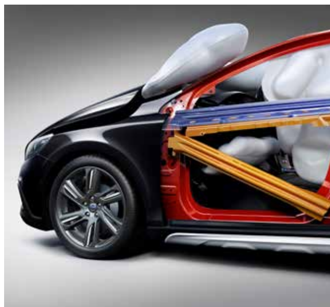
Genomskäring av en Volvo V40.

I början av 1900-talet kan man säga att bilen var färdig. Det var den bensindrivna bilen med en så kallad förbränningsmotor som blev den teknik som slog igenom på allvar. Medan ångmaskinen omvandlar vattenånga till rörelseenergi, så skapar förbränningsmotorn rörelseenergi genom antändning av en blandning av luft och bensin eller dieselolja. Med den kunde bilarna gå betydligt snabbare och köra längre sträckor. Efterhand har bilarna utvecklats på många sätt. Motorn har placerats fram, styrspaken har ersatts med en ratt och bilarna har fått luftpumpade hjul. Det här har gjort att det blivit bekvämare för både förare och passagerare. Även motorerna har blivit bättre och mer energisnåla. Bilarna har också blivit säkrare med till exempel säkerhetsbälten, krockkuddar och bättre karosser.