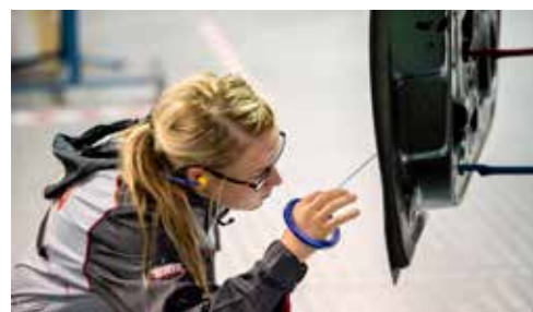
Några exempel på yrken där du arbetar med fordon; racingmekaniker, fordonsmekaniker och fordonslackare.