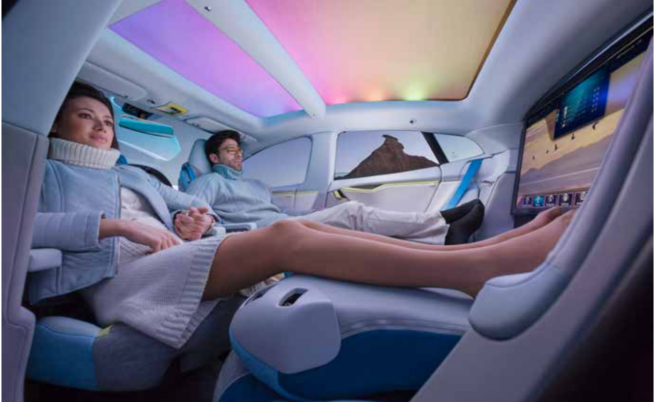
Med ögon på tv-skärmen istället för på vägen i den förarlösa bilen.

Idag finns det bilar med så kallade farthållare som ser till att bilen kör i rätt hastighet. Det finns bilar som parkerar sig själva. Bilar som automatiskt håller sig på vägen och inte hamnar i diket eller riskerar att krocka med andra bilar. Nu har även bilar som helt kör sig själva utvecklats. Föraren behöver inte hålla händerna på ratten utan bestämmer resmålet och sen gör fordonet resten. Under tiden kanske föraren tittar på film, läser eller sover en stund. Vad tror du, är det så här vi kommer att färdas i framtiden?