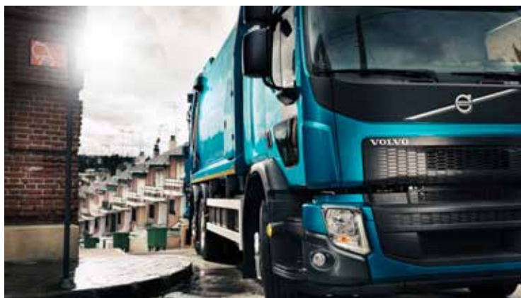
Modern lastbil från Volvo.