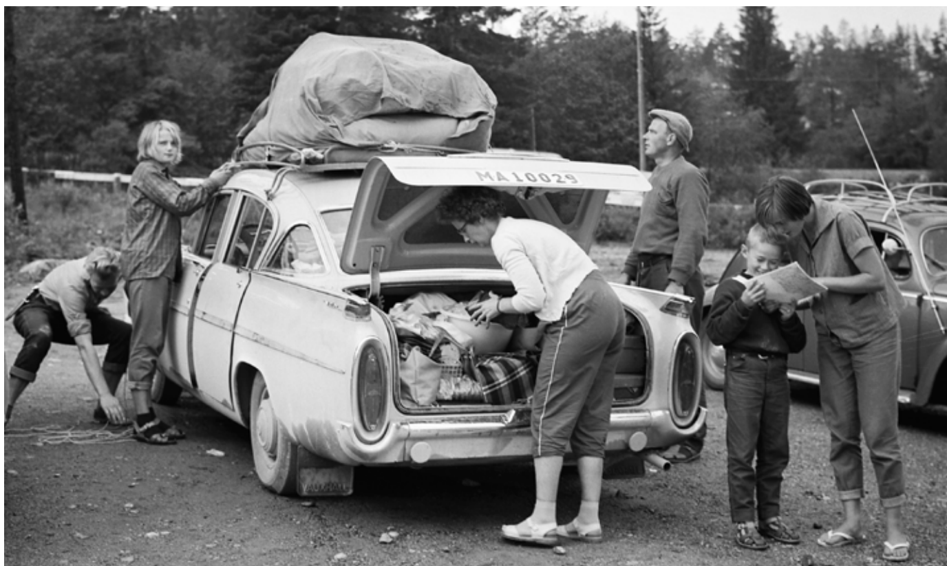
Bilsemester ca 1960.