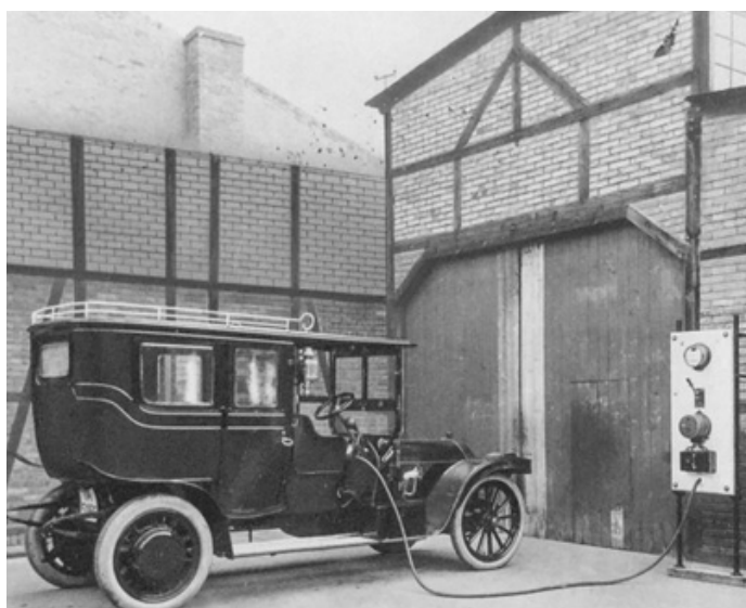
Elbil laddas ca år 1900.

Idag blir det alltmer vanligt med elbilar som drivs av en eller flera elmotorer som får ström av batterier. Men elbilen är inte ny, den uppfanns redan i mitten av 1800-talet. En av de första som köpte en elbil var sultanen Abdül-Hamid i Turkiet. Han fick höra talas om en självgående vagn i England och blev så intresserad att han genast beställde en. Elbilar blev i början populära som stadsbilar och var under en period vid sekelskiftet 1900 den vanligaste bilen. Men efter ett tag tröttnade många på elbilen eftersom batterierna behövde laddas väldigt ofta. Idag har elbilen blivit allt vanligare igen. Det beror på att batteritekniken har utvecklats så att bilarna kan köra längre sträckor innan de behöver laddas.